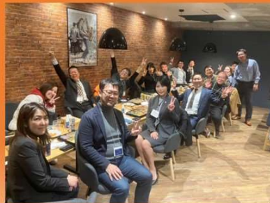
※関西支部 プレイベント写真