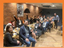
※関西支部 イベント写真